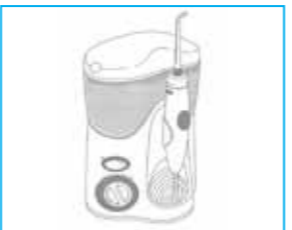
8. 세정이 끝난 후 팁을 제자리에 꽂아 잘 보관해 주세요.