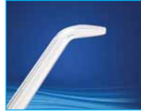
기본 제트 팁 3개 Jet Tip 워터픽에서 일반적으로 사용하는 기본적인 세정 팁입니다. (6개월마다 교체 권장)