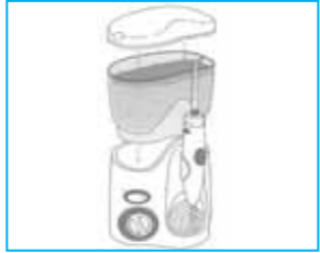
1. 수조와 본체를 잘 결합하고 수조에 물을 붓습니다.