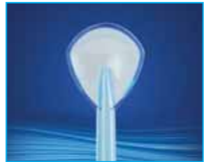
혀클리너 Tongue Cleaner 혀클리너는 깔끔한 혀 세정을 가능하게 합니다. 혀의 표면은 매끄럽지 않고 거칠어 미세한 음식물 잔사나 설태등이 끼기 쉽습니다. 설태를 제거하여 입냄새 제거, 방지에 도움이 됩니다. (6개월마다 교체 권장)