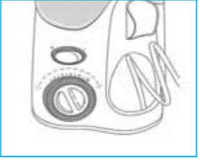
4. 수압조절 버튼을 가장 낮은 단계로 맞추세요.