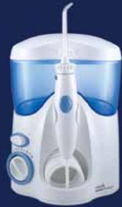
waterpik waterflosser Ultra Water Flosser WP-100K