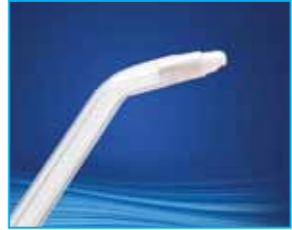
치열교정 팁 Orthodontic Tip 치솔이 닿기 힘든 교정기 주위에 칫솔질과 세정을 동시에 함으로써 치열교정중 깨끗한 관리를 할 수 있습니다. (3개월마다 교체 권장)