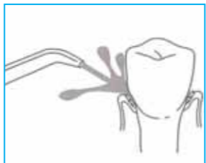
7. 치아쪽을 겨냥한 다음 원하는 세기로 천천히 수압을 올리며 세정합니다.