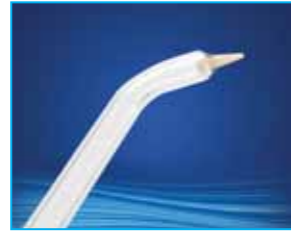
픽 포켓 팁 Pik Pocket™ Tip 물이나 항생용액을 잇몸선 밑의 깊은 곳까지 전달하는 것으로 일반적인 용도는 아니며 사용시 물의 수압을 가장 낮게 하십시오. (3개월마다 교체 권장)