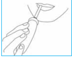
5. 세면대위로 몸 상체를 낮게 구부리고 팁을 입에 넣은 후 입을 약간 벌려주세요.