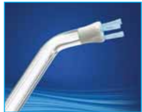
플라그 팁 Plaque Seeker™ Tip 효과적으로 이 사이에 낀 음식물찌꺼기를 빼내주며 플라그 제거, 방지에 도움이 됩니다. (3개월마다 교체 권장)