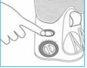
6. 전원스위치를 위로(ON) 올려주세요.