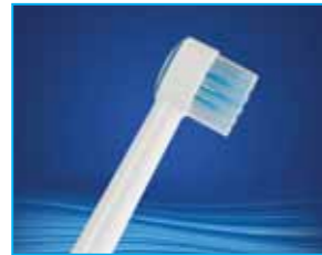
치솔팁 Toothbrush Tip 세정과 동시에 치아표면을 부드럽게 닦아주는 팁입니다. (3개월마다 교체 권장)